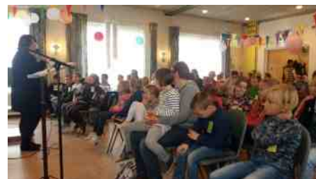
Impressie Vakantie Bijbel Week